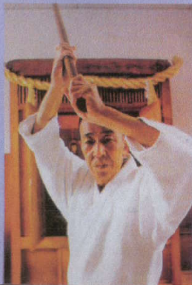
Hikisutchi sensei fut l'un des disciples les plus proche du fondateur de l'Aïkido.